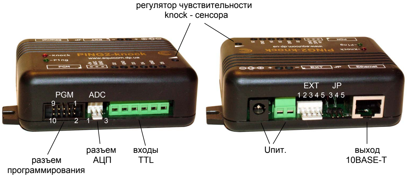
Рис. 1 PING2-knock